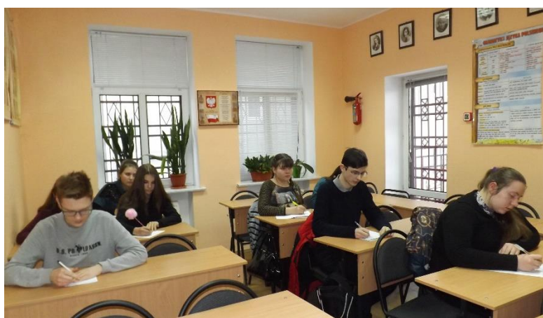
Dyktando piszą uczniowie VII-IX klasy