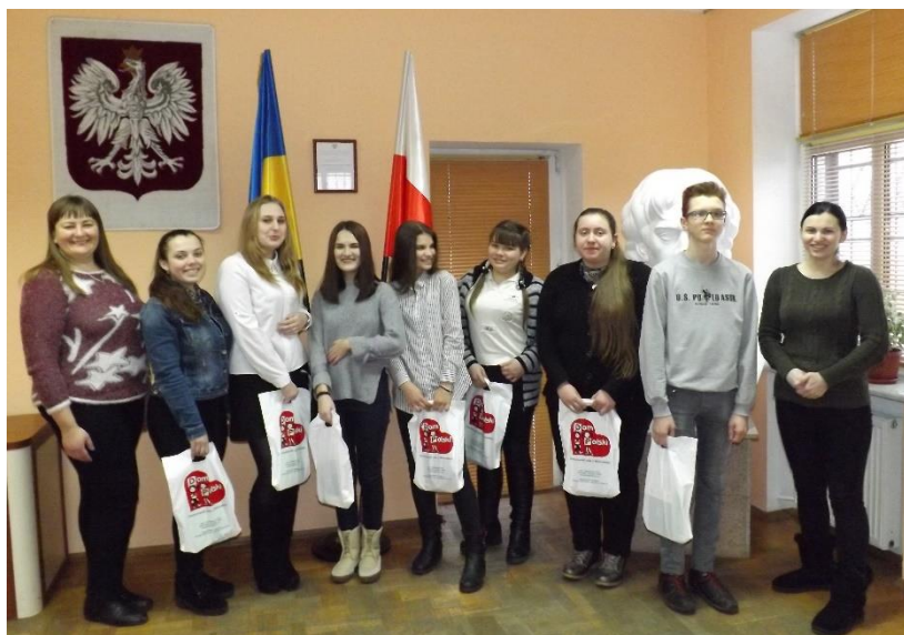
Uczniowie, które wykazały się najlepszymi wynikami w dyktando oraz ich nauczyciele

w historii obu państw czasy, kiedy nie wolno było używać swego języka ojczystego i był on zabroniony.