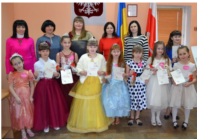
Uczestniczki konkursu w młodszej kategorii wiekowej