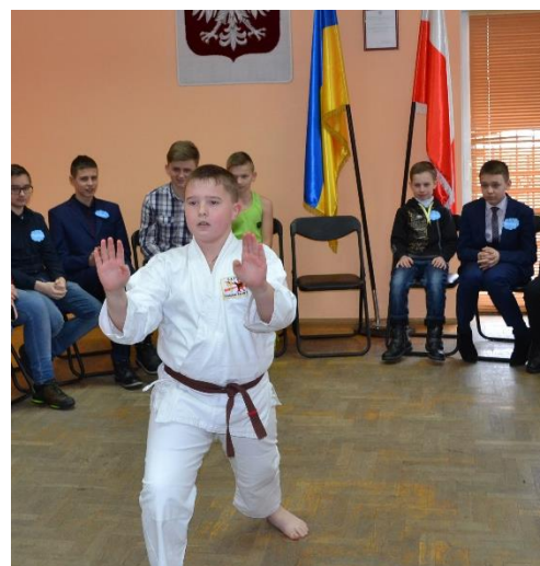
Uczestnicy konkursu prezentują swoje talenty