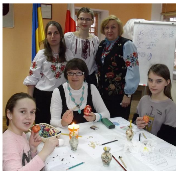
Podczas warsztatu pisankarskiego