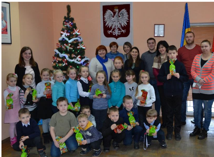
Uczniowie 1 A klasy z rodzicami i nauczycielami