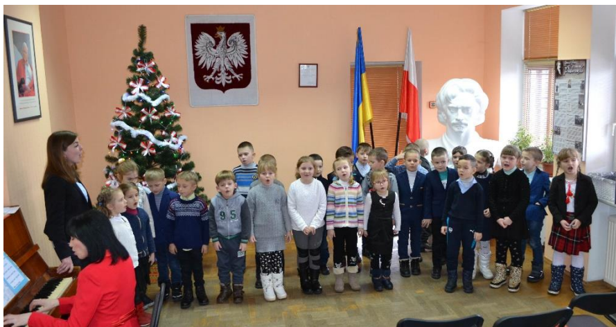
Kolędują uczniowie 1 B klasy