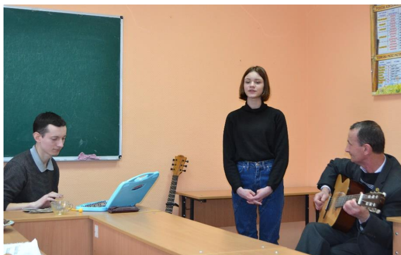
Mini-koncert polskiej piosenki w wykonaniu gości ze szkoły denyszowskiej

Bez wątplenia obowiązkiem każdego człowieka jest poznanie historii swej rodziny, jej dawnych tradycji i obyczajów. Sięgając do swoich korzeni, oddajemy hołd swoim przodkom, a ich życie czasami było bardzo ciężkie i nie niezbyt długie. Pamiętając o nich, staramy się przedłużyć ich życie w następnych pokoleniach.