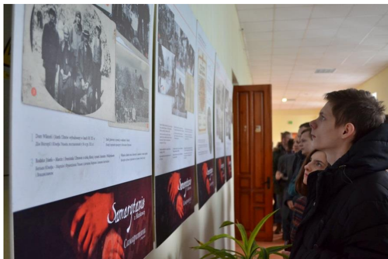
Wystawa "Samarytanie z Markowej" na Uniwersytecie Żytomierskim będzie eksponowana do 12 kwietnia

Organizatorem wystawy w Żytomierzu jest Polski Instytut w Kijowie, Konsulat Generalny Rzeczypospolitej Polskiej w Winnicy, współorganizatorzy – Dom Polski w Żytomierzu oraz Żytomierski Uniwersytet Państwowy imienia Iwana Franki.