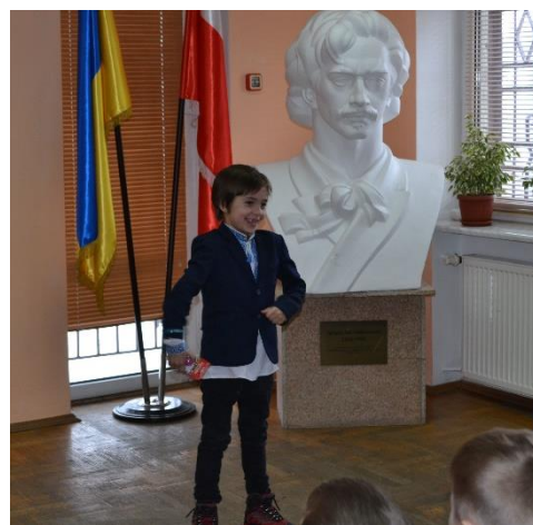
Maluchy pięknie recytowały polską poezję