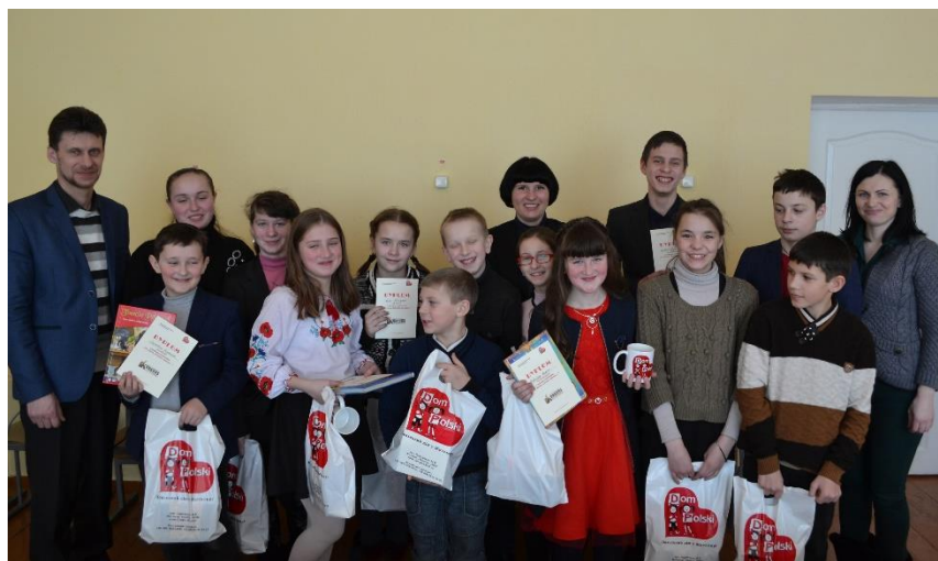
Uczestnicy konkursu recytatorskiego w szkole denyszowskiej

Wszyscy uczestnicy konkursu otrzymali prezenty od Domu Polskiego oraz książki od Polskiej Biblioteki Narodowej i Polskiego Instytutu Pamięci Narodowej.