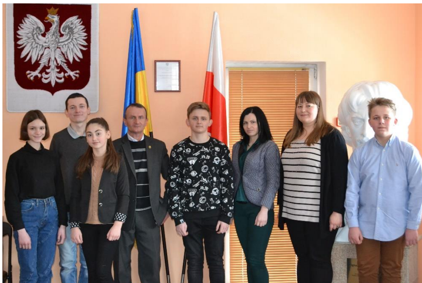
Uczestnicy spotkania w Domu Polskim

Dnia 18 marca w Domu Polskim odbyło się spotkanie tematyczne „Moja polska rodzina”. Spotkaliśmy się, żeby w ciepłej rodzinnej atmosferze porozmawiać o losach naszych polskich rodzin. O swojej polskiej rodzinie opowiadali uczniowie Sobotnich Kólek Twórczych, uczniowie denyszowskiej szkoły oraz ich nauczyciele.