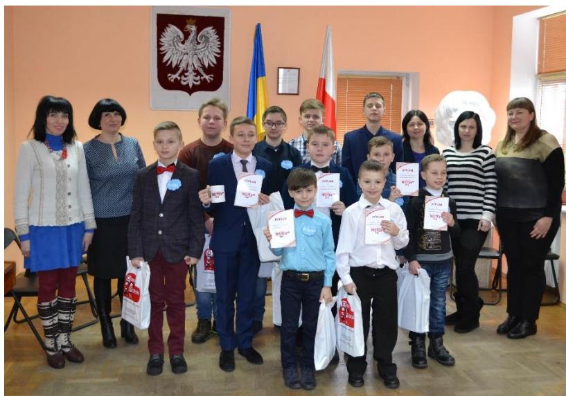
Uczestnicy konkursu „Mister Domu Polskiego 2018” z nauczycielami